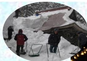
※金山神社の雪おろし