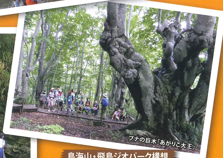
ブナの巨木「あがりこ大王」