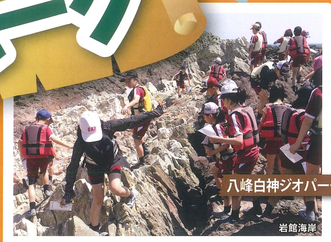
八峰白神ジオパーク