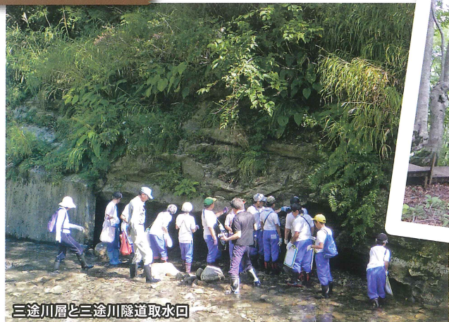
ゆざわジオパーク