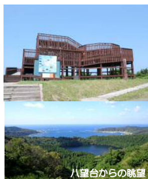
八望台からの眺望