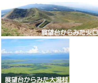
展望台からみた大湯村

火山の脅威を知る 大きな岩を積み上げたピラミッドのような形をしており、鬼が石を積み重ねて岩山を作り隠れ住んでいたと伝えられたことから、こう呼ばれる。