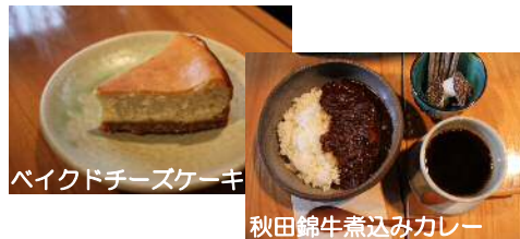
バイクドチーズケーキ

寒風山ふもとの琴川という小さな集落にあるお店。おいしいコーヒーを提供できるよう、一粒一粒丁寧に心を込めて焙煎している。 ☎0185-34-2470