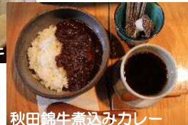
秋田錦牛煮込みカレー