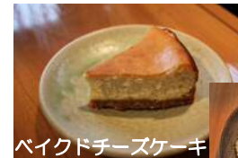
バイクドチーズケーキ

●こおひ工房珈琲 寒風山ふもとの琴川という小さな集落にあるお店。おいしいコーヒーを提供できるよう、一粒一粒丁寧に心を込めて焙煎している。 ☎0185-34-2470