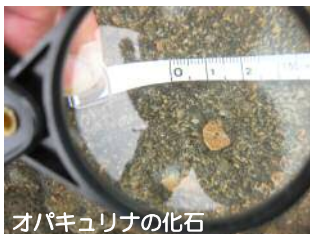
オパキュリナの化石