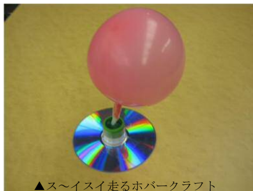
▲ス～イスイ走るホバークラフト

材料はすべて学習センターで用意します。参加対象は小学生で、募集は12月1日～20日まで(ただし定員になり次第終了)。申込先は男鹿市ジオパーク学習センターまで電話でお申し込みください(午前9時から午後4時、月曜休館)。当日は様々な最先端のエネルギーや光センサーロボットなども紹介します。今回は男鹿市が経済産業省から次世代エネルギーパークに認定されて2周年になることから企画したものです。